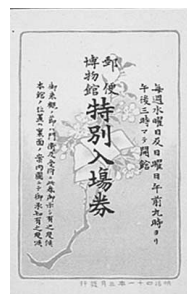
芝公園内時代の特別入場券

今回は、普段展示しない秘蔵資料の展示をします。また、絵葉書を毎日先着200名に配布します。是非お出かけください。