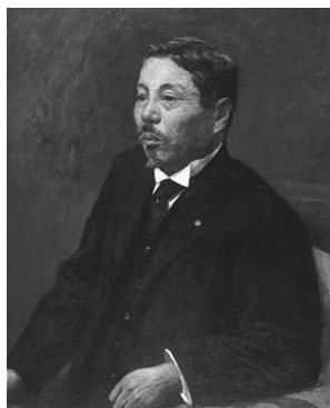
樋畑雪湖像 岡田三郎助画

また、郵便切手や絵葉書・通信日付印関係などの著書のほか、交通史関係では「江戸時代の交通文化」などを多数残しています。(井上恵子)