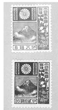
雪湖デザインの旧版富士鹿切手 大正11年(1922)1月1日発行